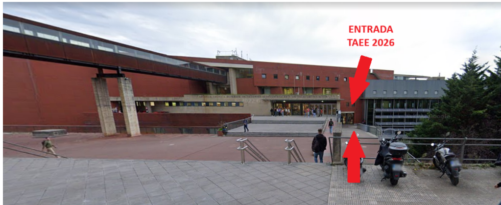
Signposted conference entrance, through which speakers and attendees must enter.

The conference is held on the lower floor (-1) of the Escuela Técnica Superior de Ingenieros Industriales y de Telecomunicación , located at Av. de los Castros, s/n, 39005 Santander (Cantabria) . Access to floor -1, where the conference takes place, is directly from the street , without needing to cross the rest of the building.