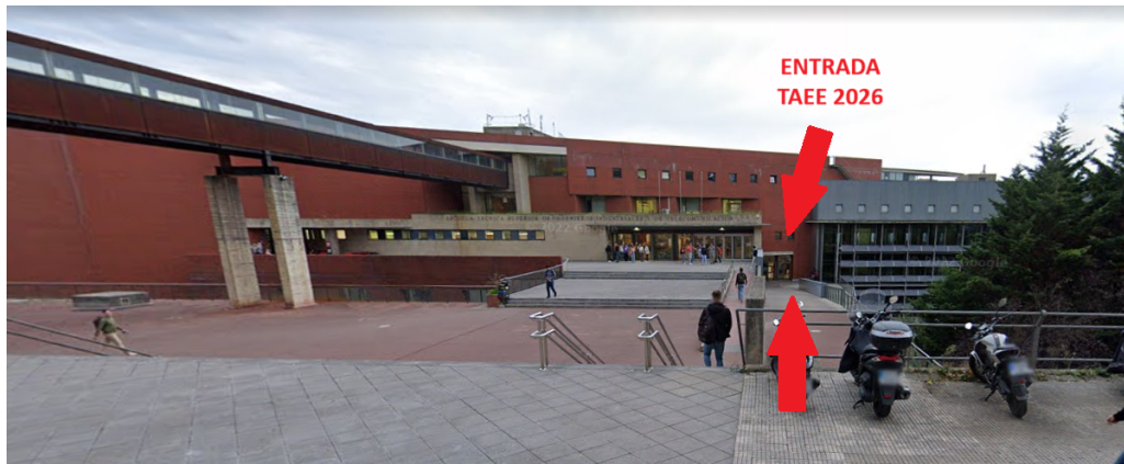
Entrada do congresso sinalizada, pela qual devem aceder os oradores e participantes.

O congresso realiza-se no piso -1 da Escuela Técnica Superior de Ingenieros Industriales y de Telecomunicación , situada na Av. de los Castros, s/n, 39005 Santander (Cantábria) . O acesso ao piso -1, onde decorre o congresso, é direto a partir da rua , sem necessidade de atravessar o resto do edifício.